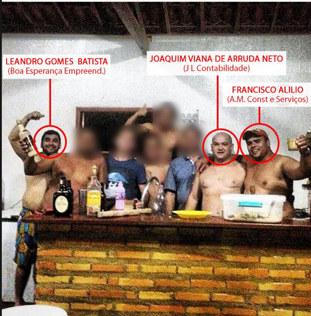
aliliomendes Visita das Lideranças #AmigosParceiros #RanchoAM 🐟 🍹 🍷 🌞 🏖️