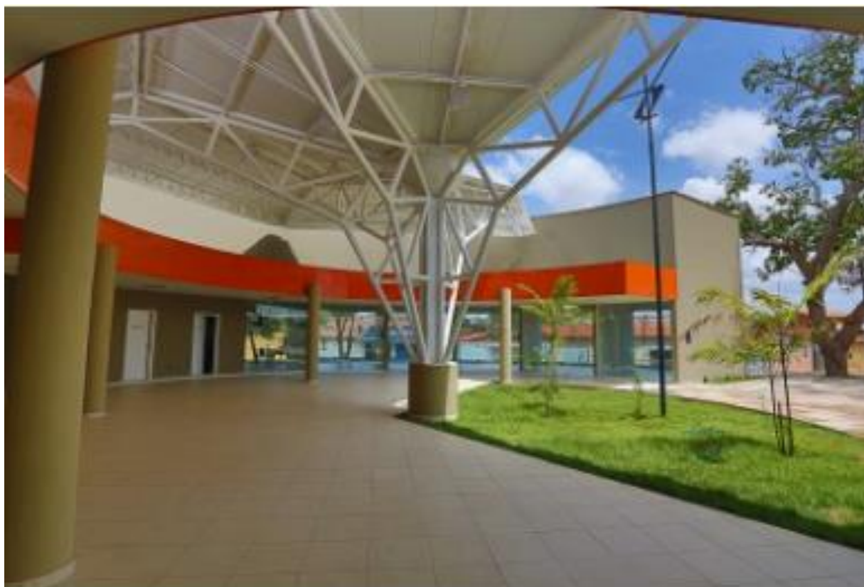
Figura 1-Sede Administrativa do Parque Ambiental Lagoas do Norte Av. Boa Esperança - Matadouro, Teresina – PI, CEP