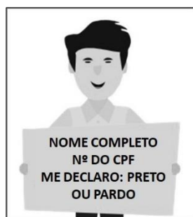
Figura 3. Modelo de Autodeclaração para o vídeo.