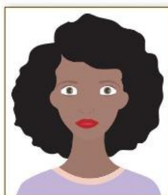
Figura 1. Modelo de Foto Frontal de Perfil