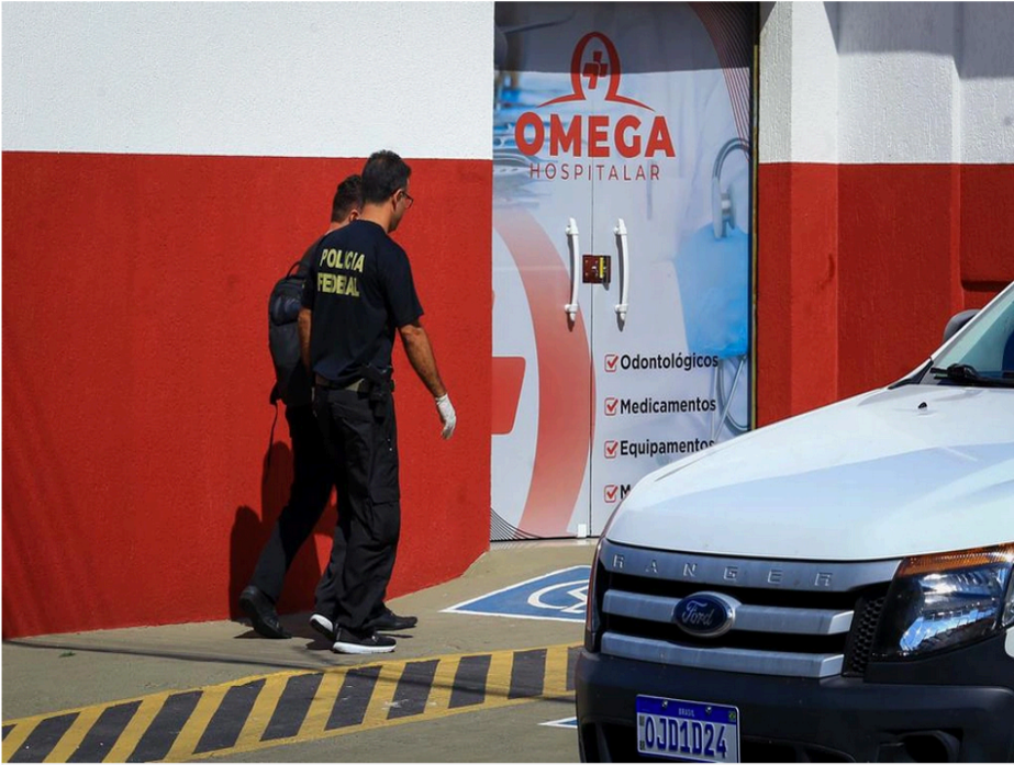
Polícia Federal cumpre mandados em distribuidora de medicamentos

Segundo a Polícia Federal, as empresas investigadas, dentre elas a Ômega Hospitalar, em Teresina-PI, e a Rad Imagem, em Timon-MA, ocupam posições de destaque no "ranking" das empresas que mais receberam recursos públicos da saúde no período de 2019-2022. Ainda conforme a Polícia Federal, há empresas que receberam a quantia de R$ 52 milhões.